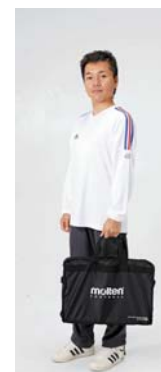
折りたためばすっきりコンパクトに収納できます