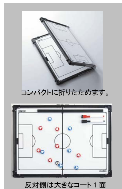
コンパクトに折りたためます。