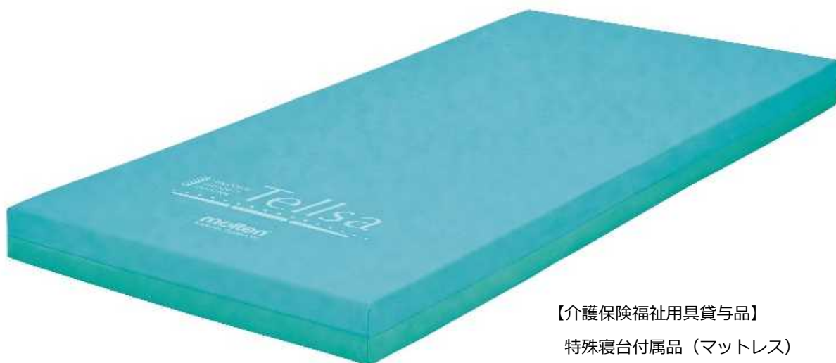
【介護保険福祉用具貸与品】 特殊寝台付属品（マットレス）

医療・福祉機器メーカーの株式会社モルテン（本社：広島市西区、代表取締役社長：民秋清史）は、質感が選べるマットレス「テルサ」を2016年4月25日（月）に発売します。