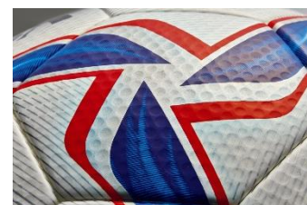
ボール表皮のディンプル加工

ボール表皮のディンプル（くぼみ）加工により、飛行中の空気抵抗を軽減し、ボール軌道のブレを抑制しました。これにより、コントロール性能がさらにアップし、より高精度のパスやシュートが可能になりました。