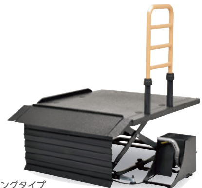
ショート/ロングタイプ