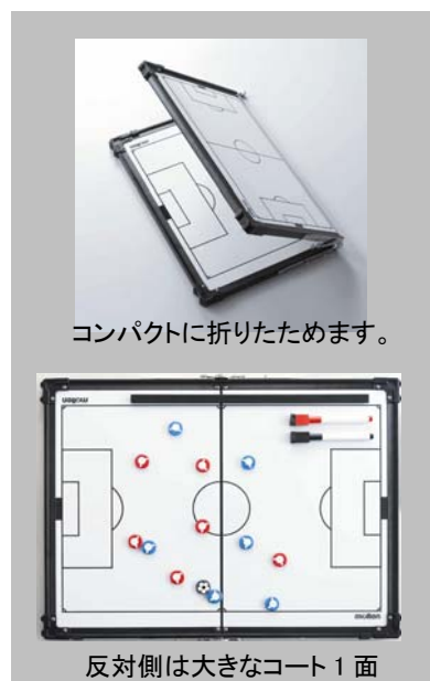
コンパクトに折りたためます。