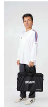
折りたためばすっきりコンパクトに収納できます