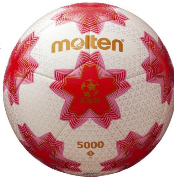
天皇杯公式試合球 (F5E5000)

競技用ボールとスポーツエキップメントメーカーの株式会社モルテン（本社：広島市西区、代表取締役社長：民秋清史）は、第95回天皇杯全日本サッカー選手権大会（以降「天皇杯」）、および第37回皇后杯全日本女子サッカー選手権大会（同「皇后杯」）に公式試合球を提供します。当社がモルテンブランドの公式試合球を天皇杯および皇后杯に提供するのはいはじめてです。