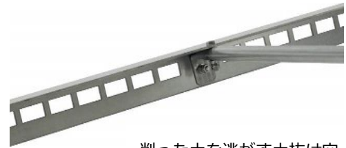
削った土を逃がす土抜け穴

8kgの重量で土をしっかり削り、180cmの幅広さで広い範囲を早くならせませす。削った土はブレードの穴から抜け、土が溜まって重みが増さない構造になっています。土は適度に散らされ、表面をふわっとした状態に仕上げます。