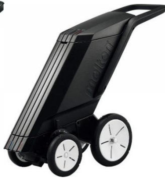
レーザーライナー 4輪