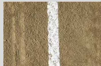
体育・練習用の消しやすい薄いライン