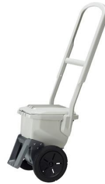
レーザーライナー ライト 2輪