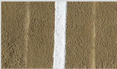
大会・体育祭用の一日中消えにくい濃いライン