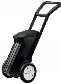
レーザーライナー 2輪

2012年に最初のモデルである2輪タイプを発売し、2015年に容量の大きい4輪タイプを追加しました。これらは大会や体育祭などで求められる、濃いラインを真っ直ぐ描く際に最適なラインカーです。今回発売するライト2輪は3つ目のモデルとなります。