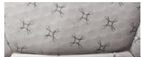
ボール表皮のディンプル加工

ボール表皮のディンプル（くぼみ）加工により、飛行中の空気抵抗を軽減し、ボール軌道のブレを抑制しました。これにより、コントロール性能がさらにアップし、より高精度のパスやシュートが可能になりました。