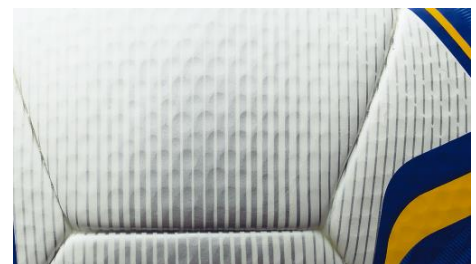
ボール表皮のディンプル加工