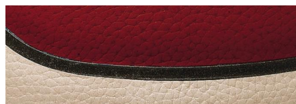
新色の天然皮革・新シボ形状

新色の天然皮革を採用し、チャンネルにも天然皮革と相性の良い色を配しました。さらに新シボ形状と焼印印刷を採用することによって、天然皮革の美しさを引き出しています。