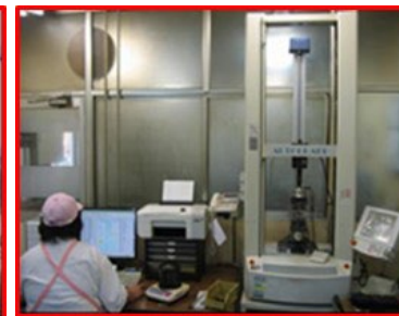
キュラストメーター