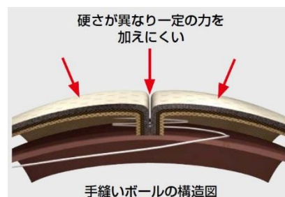
手縫いボールの構造図