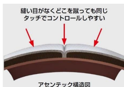
アセンテック構造図

独自の熱接合技術により、手縫いでは不可能であった、なめらかでつなぎ目のない表皮構造を実現しました。真球性に優れ、どこを蹴っても同じ感触でプレーすることが可能になります。