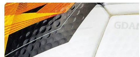
ボール表皮のディンプル加工

ボール表皮のディンプル（くぼみ）加工により、飛行中の空気抵抗を軽減し、ボール軌道のブレを抑制しました。これにより、コントロール性能がさらにアップし、より高精度のパスやシュートが可能になりました。(F5U5003-K0)