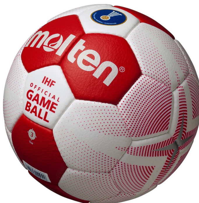
ヌエバ X5000 IHF スペシャルエディション