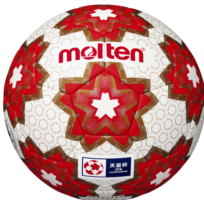
天皇杯公式試合球 (F5E5000-H)

競技用ボールとスポーツエキップメントメーカーの株式会社モルテン（本社：広島市西区、代表取締役社長：民秋清史）は、天皇杯 JFA 第100回全日本サッカー選手権大会（2020年5月23日-2021年1月1日）に、リニューアルされた公式試合球を提供いたします。