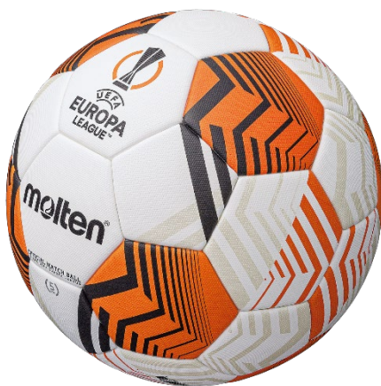
先進性や力強さをイメージしたデザイン

UELとUECLの試合球デザインは両リーグ統一の「エナジーウェーブ（選手、スタッフ、ファンの情熱を表現）」というコンセプトに基づいています。ただ、それぞれのリーグが表すエナジーウェーブは大会の特徴やトロフィー形状に拠りもたらされており、UEL試合球は先進性や力強さといった大会の特徴を、UECL試合球は幾何学的で屈曲のあるトロフィーデザインから着想されています。