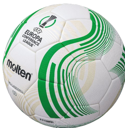
幾何学的な屈曲を特徴としたデザイン