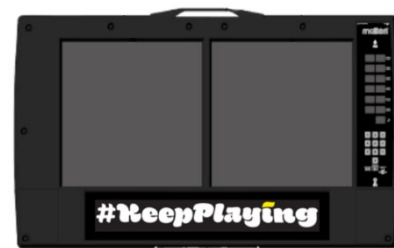
WE リーグ専用選手交代ボード