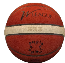
W リーグ専用試合球