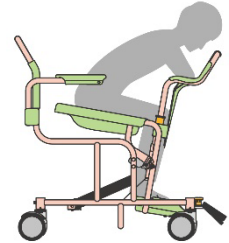
改良後（傾き角度 10 度）