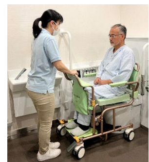
Smooverに乗ったまま、トイレへ移動できます