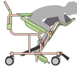
弊社従来品（傾き角度 30 度）

従来品では着脱衣の際の傾き角度を 30 度に設計していましたが、10 度へ調整することにより、事故や転倒のリスクが低減し、着脱衣の利便性は維持したまま、利用者様の安心感と快適性を向上させました。