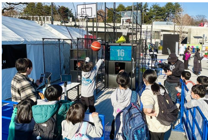
※SoftBank ウインターカップ 2024 会場でのフィールドトライアルの様子