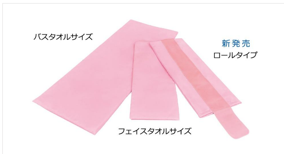
マルチパッド 『ポジパッド』

株式会社モルテン（本社：広島市西区 代表取締役社長：民秋清史、以下、モルテン）は、適切な体位保持（ポジショニング）を目的としたポジショニングクッション『ポジパッド』シリーズに、新形状となるロールタイプを新たに追加し、医療・福祉現場への提供を開始します。