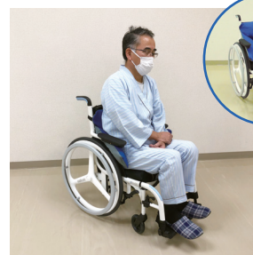
シーポスエレフで姿勢を改善