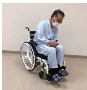
姿勢が崩れた状態

カバー裏面の取り付けベルトにより、車いすバックレスト（背もたれ）に簡単に取り付けることができます。また、カバー裏面は滑り止め加工を施し、クッション自体が移動するのを防ぎます。