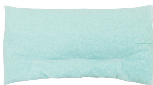
インナークッション

特殊なクッションビーズ素材を使用し、心地よい触感で適度な体圧分散性があります。また、体重がかかり中身がつぶされても通気空間があるため、むれにくくなっています。