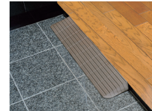
玄関(あがりかまち)の段差