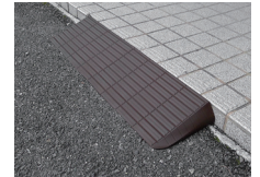
玄関先や庭先の段差