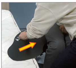
スライディをお尻の下に差し込む