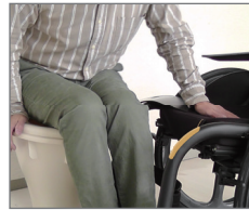
車いす ~ 便座