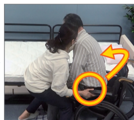
腰に手を手をあてスライドさせる