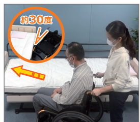
車いすを30度ぐらいを目安にベッド脇に付ける