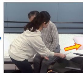
スライディを引き抜き移乗完了