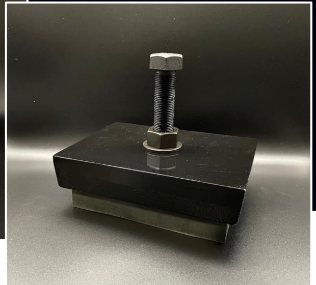
レベルマウント (ALKJ40 / ALKJ80)