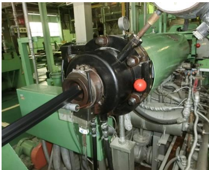
シリンダーヘッド 口金部分