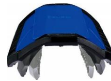
両サイドが曲がります

スワンセパッドの、グリップ性能の高さに加え、ハードシェル部の6カ所のヒンジが曲がることで、選手個人のスネの形にそってフィットするので、さらにずれにくくなりました。