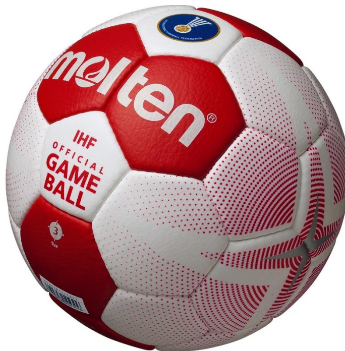
ヌエバ X5000 IHF スペシャルエディション