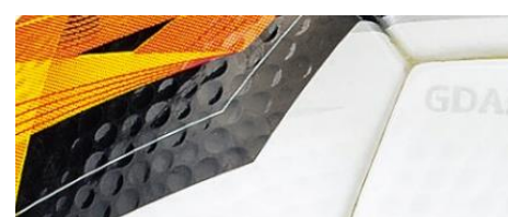
ボール表皮のディンプル加工

ボール表皮のディンプル（くぼみ）加工により、飛行中の空気抵抗を軽減し、ボール軌道のブレを抑制しました。これにより、コントロール性能がさらにアップし、より高精度のパスやシュートが可能になりました。(F5U5003-K0)